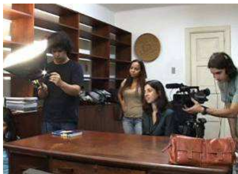
Estudantes em laboratório

Os participantes ou agentes do Núcleo de Audiovisual e Documentário encontrarão nas imagens e nos sons sua base de pesquisa, sua metodologia de realização científica e seu material de interpretação. Em suma: um universo de investigação e produção promissor.