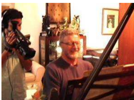
Entrevista filmada com o antropólogo Peter Fry